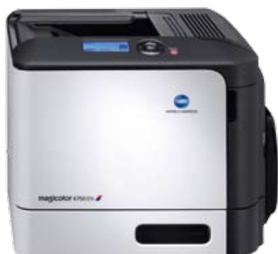
magicolor 4750EN magicolor 4750DN wersja standardowa