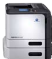
magicolor 4750EN magicolor 4750DN wersja z opcjonalnym dolnym podajnikiem papieru

Modele magicolor 4750EN i 4750DN są doskonałymi drukarkami sieciowymi o prędkości roboczej 30 str./min (zarówno w trybie kolorowym, jak i monochromatycznym). Wbudowany moduł druku dwustronnego modelu magicolor 4750DN zapewnia obsługę wydruków dwustronnych przy pełnej wydajności. Oba modele są bogato wyposażone i dysponują procesorem 800 MHz, 256 MB pamięci oraz interfejsem sieciowym Gigabit Ethernet, a ponadto obsługują języki PCL, PostScript i, opcjonalnie, XPS. Użytkownicy często drukujący duże ilości dokumentów mogą rozbudować urządzenie o opcjonalny dolny podajnik papieru, który maksymalizuje wydajność.